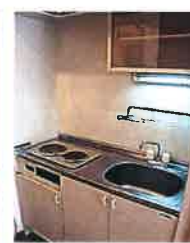
キッチン (2口電気コンロ)