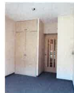
居室 (照明・エアコン付)