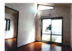
リビング・ダイニング (照明・エアコン付)