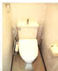
トイレ (ウォシュレット付)