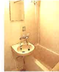
ユニットバス (換気乾燥機付)