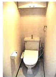
トイレ (ウォシュレット付)