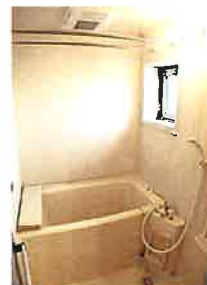
窓付ユニットバス (換気乾燥機付)