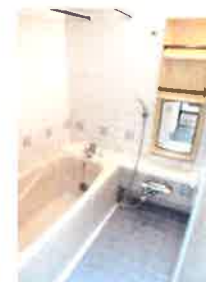
ユニットバス (追い炊き機能付) (換気乾燥機付)