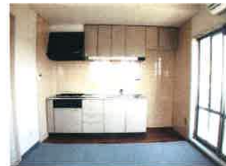
システムキッチン (3口ガスコンロ)