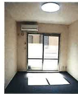
居室 (照明・エアコン付)