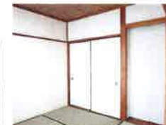
和室(床の間付) (照明・エアコン付)