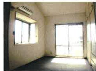
洋室 (照明・エアコン付)